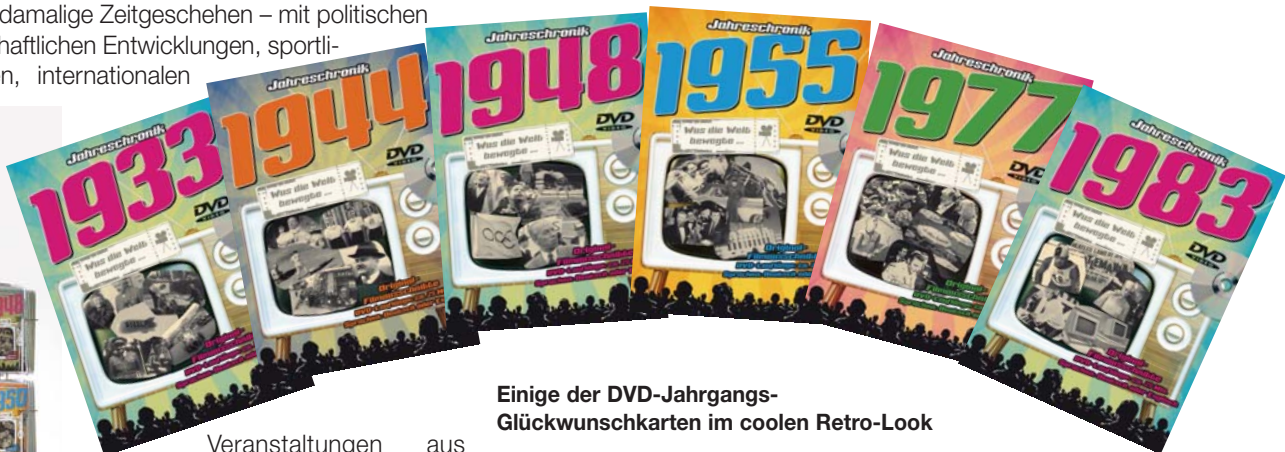
Einige der DVD-Jahrgangs-Glückwunschkarten im coolen Retro-Look