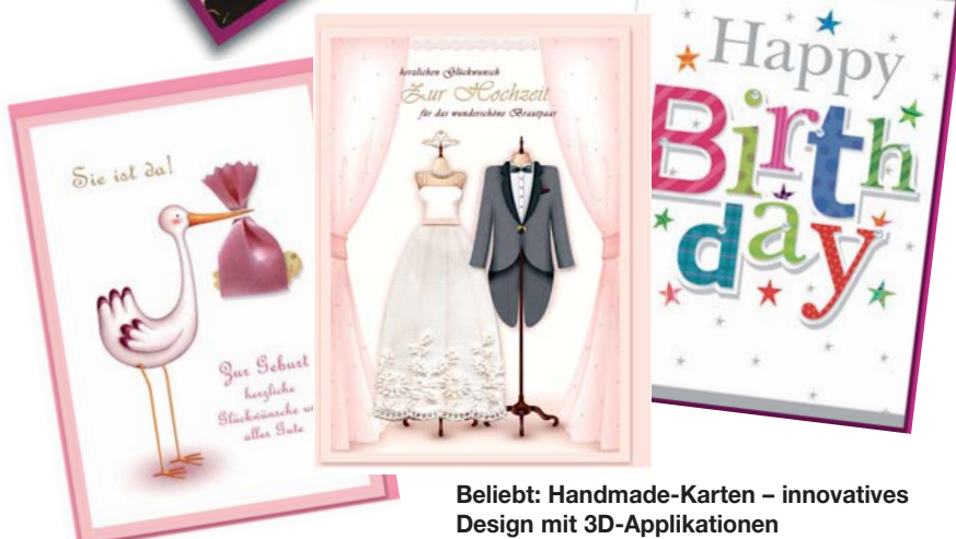
Beliebt: Handmade-Karten – innovatives Design mit 3D-Applikationen

Ein Highlight im Programm von ExtraPresents sind die aufwendig gestalteten Handmade-Karten, die durch die Kombination modernes Design und handgearbeitete 3D-Applikationen überzeugen. Zu den aktuell 120 innovativen Motiven im klassischen C6-Format für alle wichtigen Anlässe des Lebens wurden nun auch neue Motive in den Formaten A4 und A5 in den Handel gebracht.