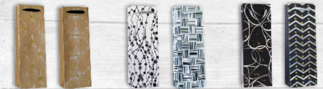
06-0286 Flasche | 3,00 € mit Goldfolie & Silber - Glitzer