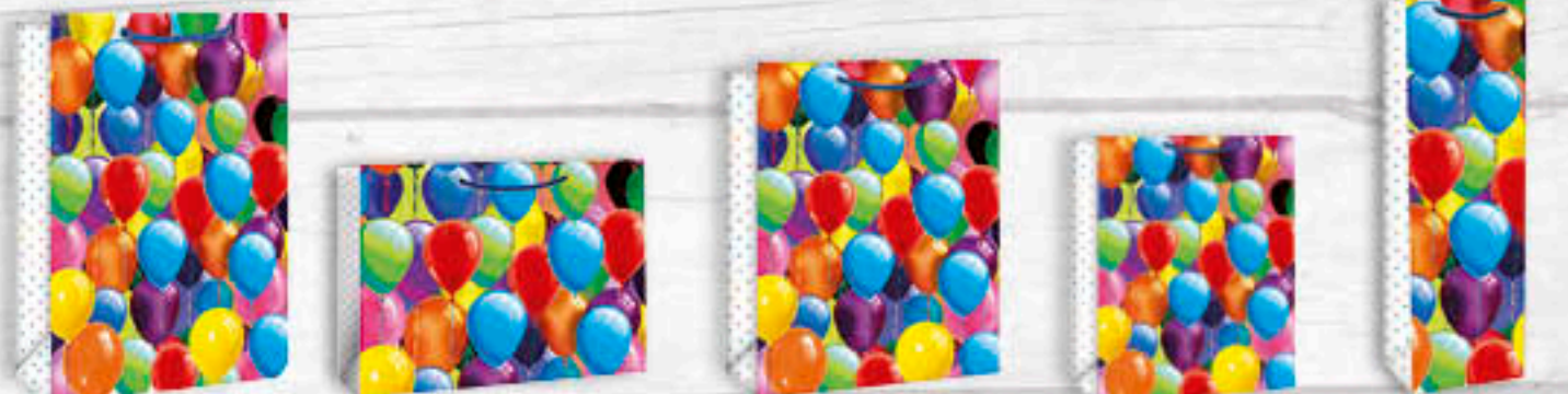
06-0411 Jumbo | 3,50 €