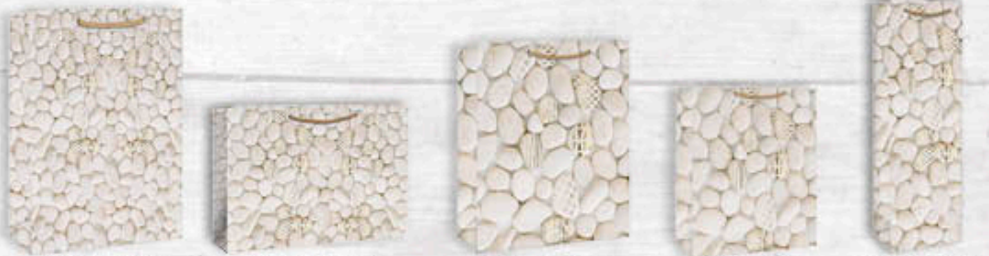
06-0401 Jumbo | 3,50 €