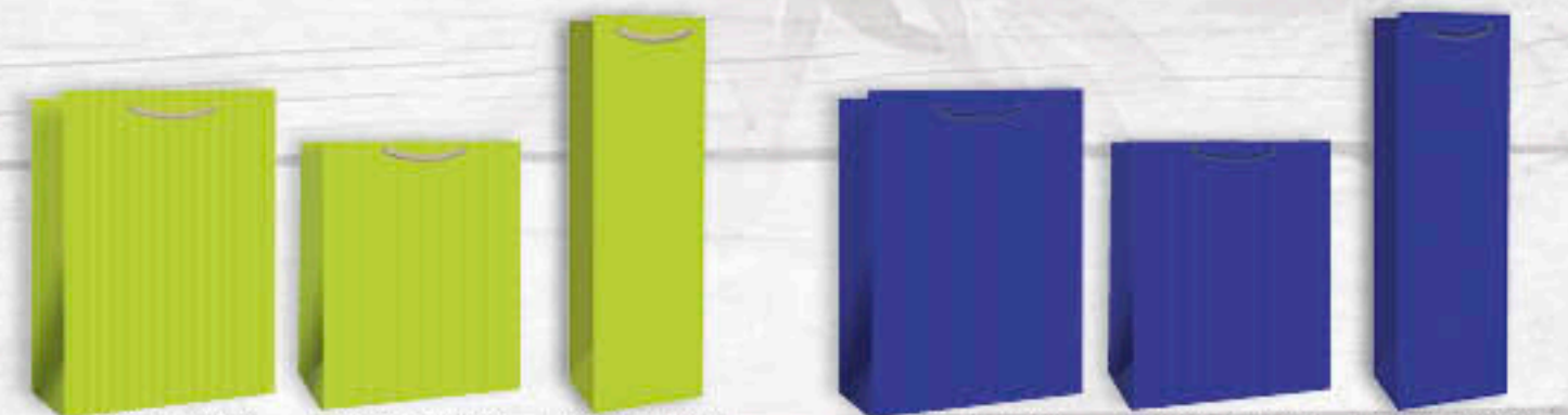
06-0505 A4 | 2,50 €