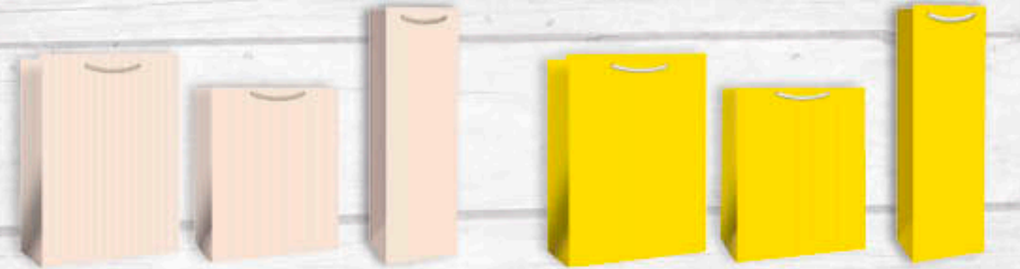
06-0513 A4 | 2,50 €