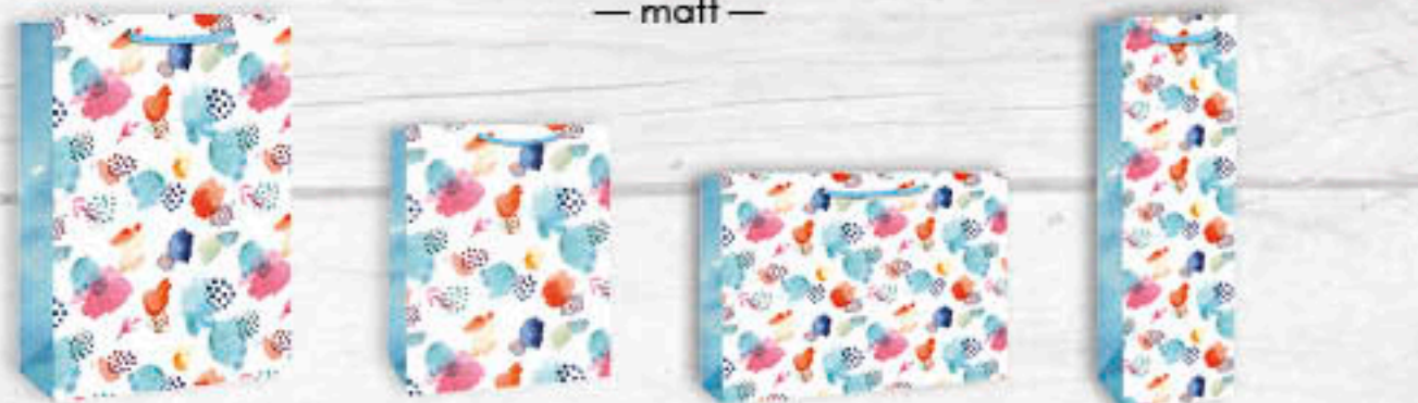
06-0351 Jumbo | 3,10 €