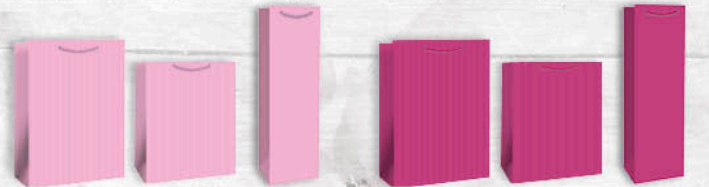
06-0498 A4 | 2,50 €