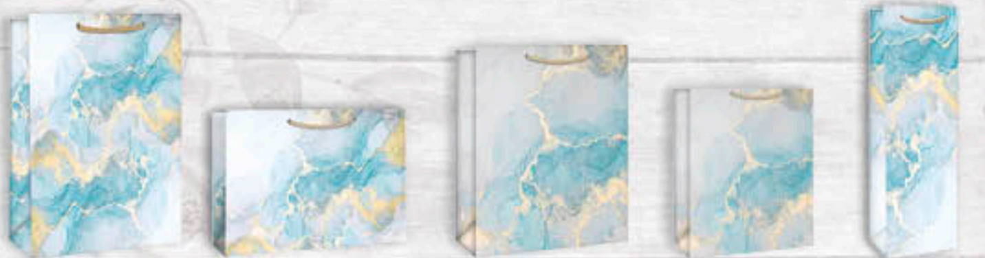
06-0406 Jumbo | 3,50 €