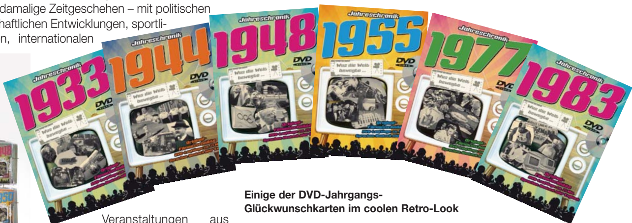
Einige der DVD-Jahrgangs-Glückwunschkarten im coolen Retro-Look